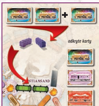
Przykład 3 Gracz zagrał 2 karty Lokomotywy, odkrył 1 kartę Lokomotywy; gracz musi zagrać jeszcze 1 kartę Lokomotywy.

Gracze nie zdradzają treści swoich Biletów aż do momentu końcowego punktowania. Gracz może w trakcie gry posiadać dowolną liczbę Biletów.