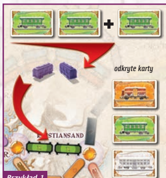
Przykład 1 Gracz zagrał 2 zielone karty Wagonów, odkrył 1 zieloną kartę Wagonu; gracz musi zagrać jeszcze 1 zieloną kartę Wagonu (albo Lokomotywy).

będących celem podróży gracza. Na koniec gry Bilet może mu przynieść nagrodę albo karę. Jeśli przed końcem gry graczowi uda się utworzyć nieprzerwany ciąg połączeń swojego koloru między wskazanymi na Bilecie miastami, otrzyma punkty wynikające z wartości punktowej Biletu. Jeśli graczowi nie uda się utworzyć trasy wskazanej na Bilecie, odejmuje jego wartość od zdobytych przez siebie punktów.