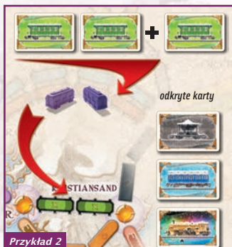
Przykład 2 Gracz zagrał 2 zielone karty Wagonów, odkrył 1 zieloną kartę Wagonu; gracz musi zagrać jeszcze 1 zieloną kartę Wagonu (albo Lokomotywy).